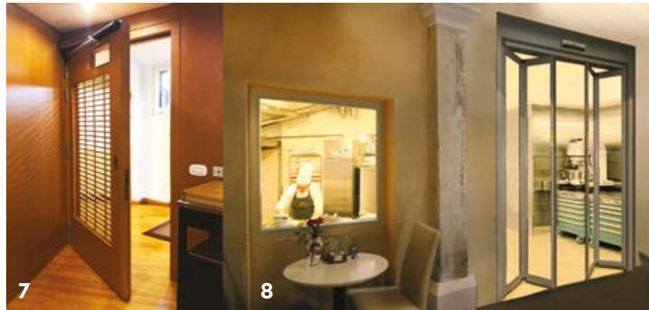
7 Hotel Raphael – DFA porta a battente per l'ingresso sala ristorazione

Un ambito d'azione importante per Ponzi, oltre alle nuove realizzazioni, riguarda anche la sostituzione di ingressi ed infissi esistenti e non più in linea né con le normative attuali, né