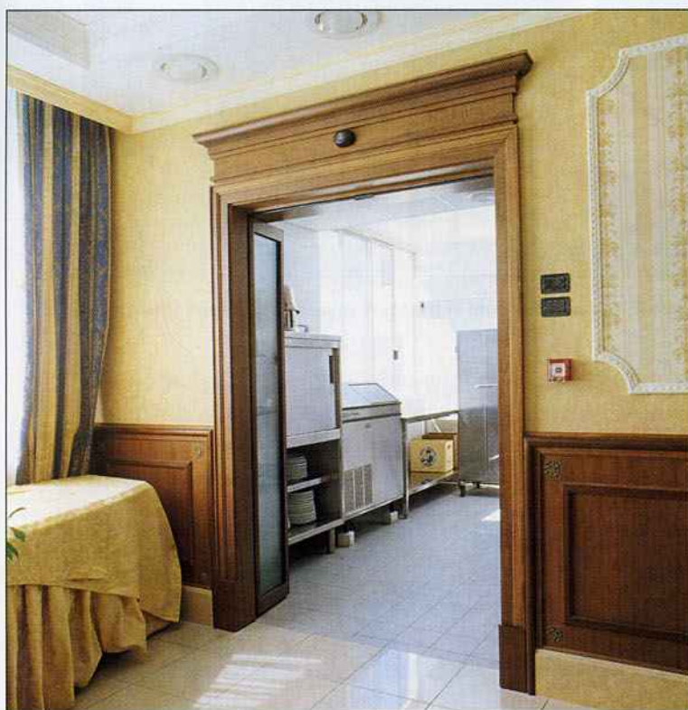
La FTA, la porta automatica ad apertura rapida, installata tra la cucina e la sala ristorante all'Hotel Parco delle Rose di San Giovanni Rotondo, sul Gargano. Può essere abbinata anche a una porta tagliafuoco REI 120

rismo, per diletto, così è diventato giocoforza anche per chi si colloca sulla filiera di questi viaggi fornendo l'ospitalità alberghiera adeguarsi alle abitudini dei loro clienti. Oltretutto, una porta automatica, sia essa lineare o girevole, concorre a definire meglio l'identità dell'entrata e anche questo diventa un messaggio subliminale importante nei confronti della clientela. Chi ha adottato la bussola girevole, perfetta inoltre per eliminare le fastidiose correnti d'aria nella reception, ha notato quasi subito che la clientela ha mutato impercettibilmente il suo giudizio nei confronti dell'albergo, giudicandolo di livello superiore. In fin dei conti, è come se l'albergo avesse deciso di presentarsi alla propria clientela in abito da sera. Si torna a un passato in cui chi entrava in albergo registrava e subiva il fascino dell'eleganza e delle buone maniere che improntavano tutto il personale al ricevimento a partire dalle livree di lavoro: il frac con le code per il concierge, l'abito da sera per il resto del personale. Lo stesso per la sala del ristorante. "A Milano stiamo installando la prima Crystal Tourniket all'Hotel Enterprise in via Sempione. E' una porta girevole in cristallo interna, molto elegante. Al Sol Melià di Milano, che è stato aperto a metà settembre, abbiamo installato una porta girevole Tourniket da 360 centimetri di diametro. All'Excelsior di Roma abbiamo creato una faccia-