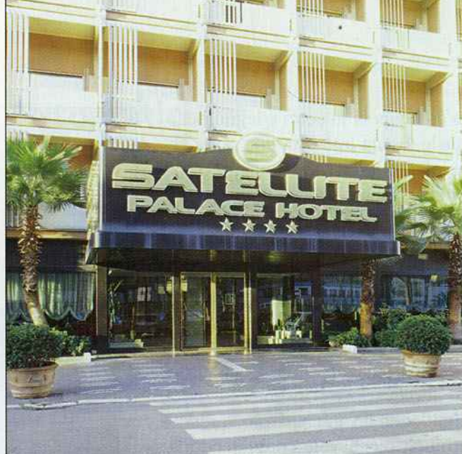
La porta scorrevole installata all'entrata del Satellite Palace Hotel di Roma

ad apprezzare la porta automatica che si spalanca come per una sorta di magia davanti alle valigie o ai carrelli e si aspetta di ritrovare la stessa magia anche quando si reca in albergo. La grande novità proposta da Ponzi Ingressi Automatici è la porta automatica antipanico a sfondamento integrale TOS che garantisce il rispetto della legge 626 e consente l'evacuazione immediata dall'albergo in caso di emergenza, panico o incendio con la semplice spinta manuale sulle ante. Sono centinaia di milioni le persone che viaggiano in aereo per affari, per tu-