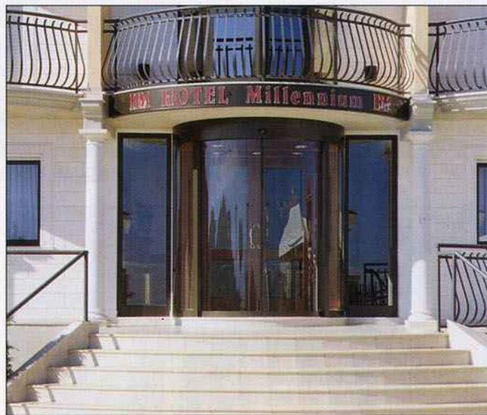
L'entrata dell'Hotel Piccolo di Afragola e dell'Hotel Millennium di San Giovanni Rotondo. Per ogni entrata una soluzione su misura firmata da Ponzi Ingressi Automatici

alle porte tradizionali grazie alle tecnologie e ai materiali innovativi da lei introdotti nel settore. Maggiore sicurezza perché gli automatismi garantiscono la chiusura anche durante le ore notturne, quando il personale magari è scarso ed è necessario che l'entrata sia regolata, mentre i meccanismi di sfondamento e antipanico degli accessi automatici sono decisamente superiori a quelli delle porte