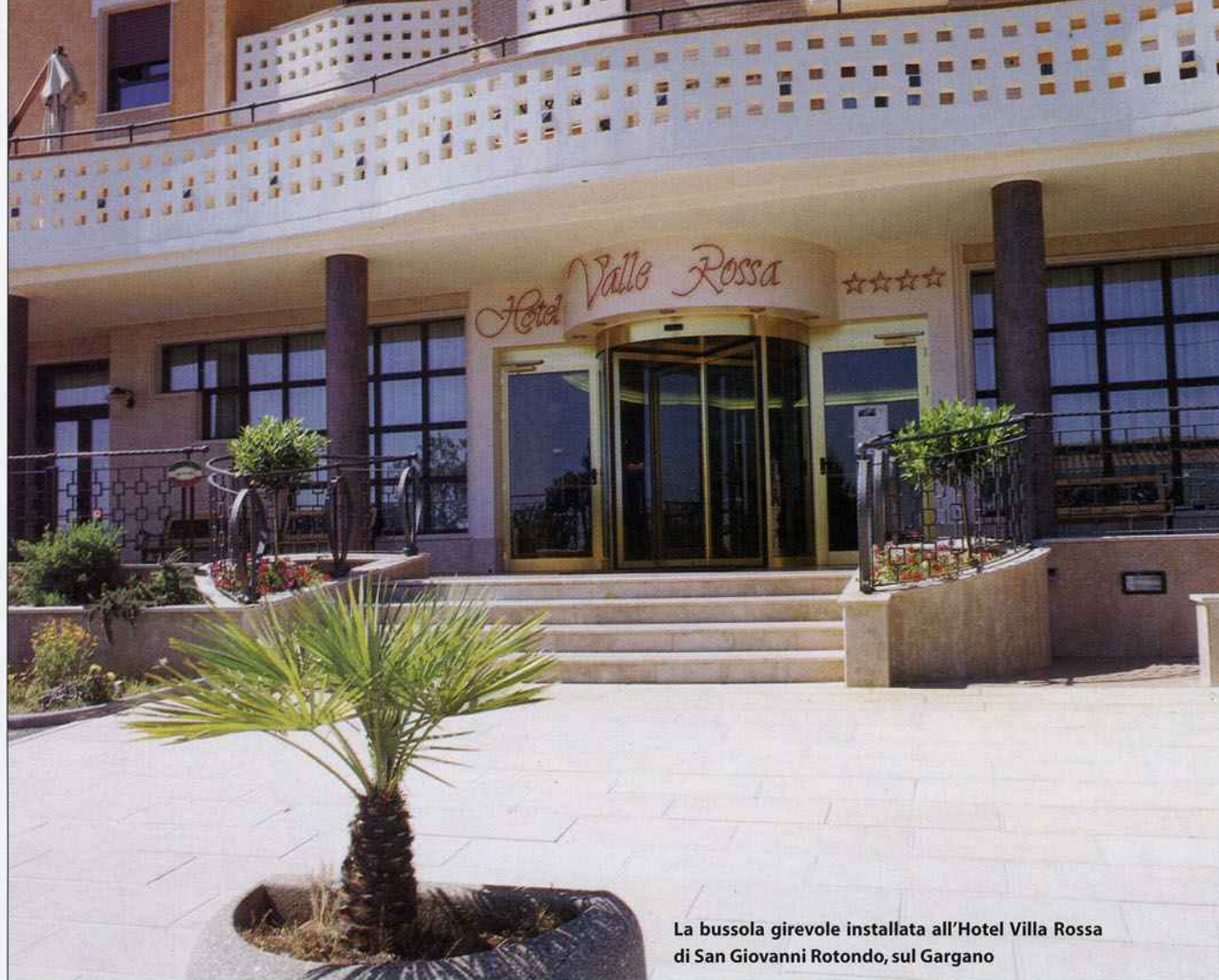
La bussola girevole installata all'Hotel Villa Rossa di San Giovanni Rotondo, sul Gargano

do su tutta la facciata dell'albergo imbottiti perimetrali in lamiera di alluminio sagomati con infissi a taglio termico appositamente progettati per ottenere un forte abbattimento acustico. Oggi chi alloggia allo Starhotel Bologna dopo un po' che sta nella hall o in camera si accorge di un'assenza: il rumore che non c'è. Quando si passa da un ambiente molto rumoroso, l'esterno dell'albergo, a un interno silenzioso, si impiega un po' per rendersene conto. E' come se il cervello impiegasse del tempo a registrare in maniera razionale il comfort uditivo in cui è penetrato nel momento in cui ha lasciato il rumore alle spalle. A un certo punto ci si rende conto di stare bene, anzi molto bene e si registra il fatto che ciò deriva dalla scomparsa della fonte di malessere: il rumore. Allo Starhotel Bologna abbiamo letteralmente abbattuto il rumore."