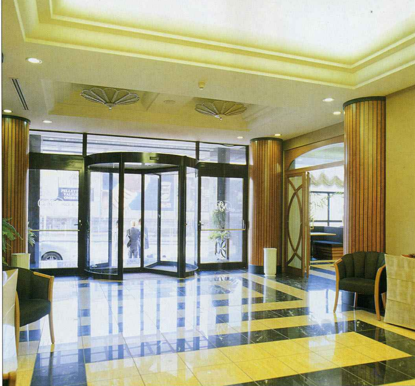
La bussola girevole installata da Ponzi Ingressi Automatici al New Europa Hotel di Napoli