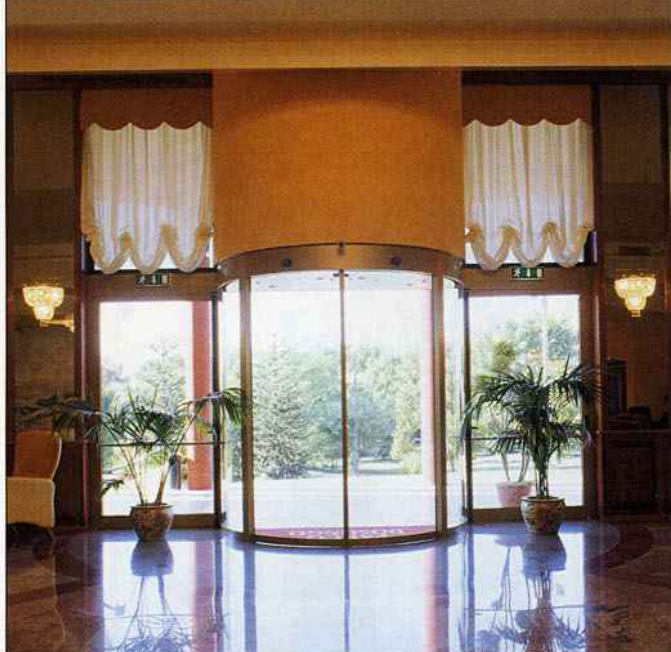
La rondina posta all'entrata del Villa Schiuma di Matera in Basilicata

tenza del cliente gioca un ruolo simbolico assai importante. E' una sorta di benvenuto e di accoglienza immediati. Chi si presenta in albergo di solito ha le mani occupate, basta una ventiquattrore e una valigia per creare imbarazzo nel momento dell'entrata se la porta non si spalanca in maniera automatica. Lo hanno capito anche gli imprenditori che gestiscono alberghi di categoria intermedia come i tre stelle, che in numero sempre maggiore adottano la soluzione dell'entrata automatica. Chiunque abbia preso un aereo e sia entrato in aeroporto ha imparato