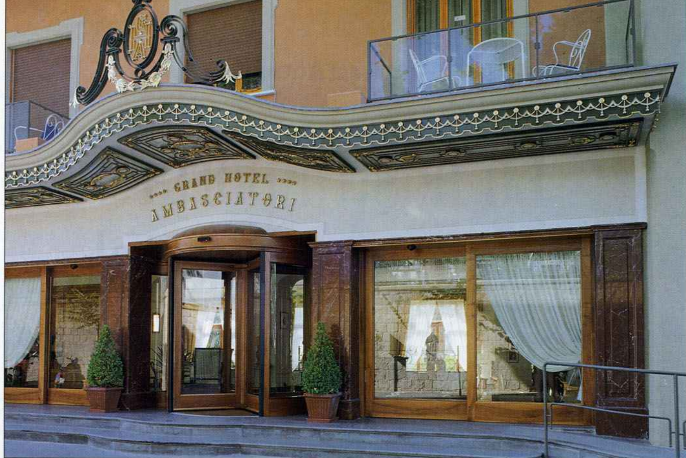
Nella pagina di apertura, l'originale facciata del Grand Hotel Paradiso di San Giovanni Rotondo, sul Gargano, con le due porte girevoli della Ponzi Ingressi Automatici. Qui sopra, la porta girevole Tourniket in legno installata al Grand Hotel Ambasciatori di Sorrento. A destra, la bussola girevole installata al Grand Hotel Villa Serbelloni di Bellagio, sul lago di Como